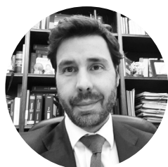
Manuel de Miguel Monterrubio Subdirector general del IRPF de la Dirección General de Tributos Ministerio de Hacienda

Miércoles, 16 de febrero de 2022 • 9:30 a 11:00 h (GMT + 1)